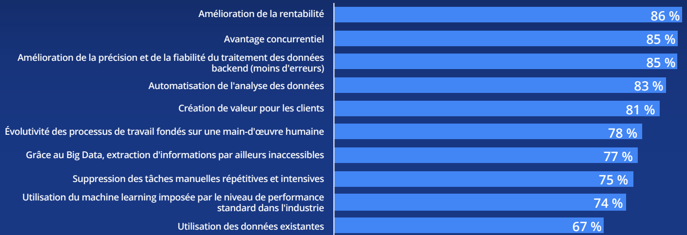
Figure 2. Avantages motivant la mise en œuvre du machine learning

IDG Research Services, mai 2017 ; critères identifiés comme décisifs ou très importants